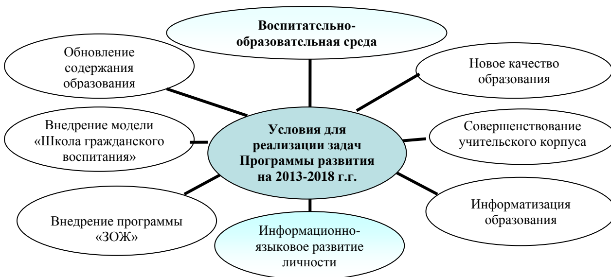
Рис. 4.1.1. Модель программы развития школы

Совет школы утвердил программу развития образовательного учреждения на 2013 - 2018 гг., единогласно выделив ее приоритетное направление: информационно-языковое развитие личности. Модель программы развития школы представлена на рис. 4.1.1.