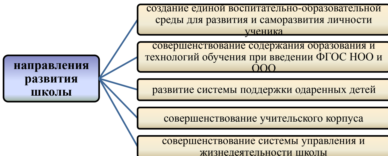
Рис.4.1.2. Основные направления развития школы.