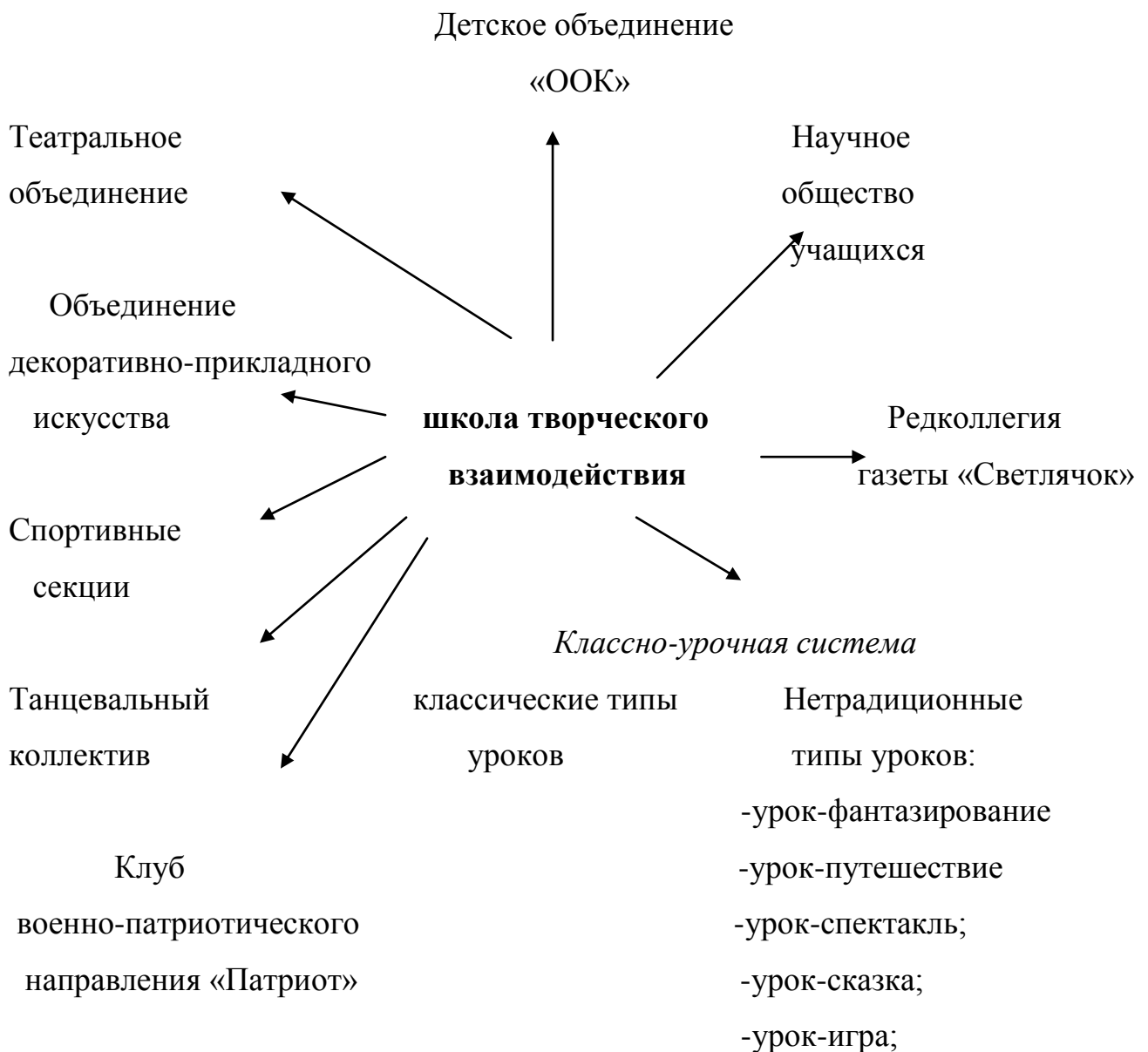
Схема взаимодействия образовательных структур школы творческого взаимодействия.